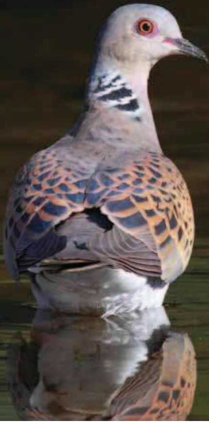
La tourterelle des bois, une espèce sensible à la densité de haies.