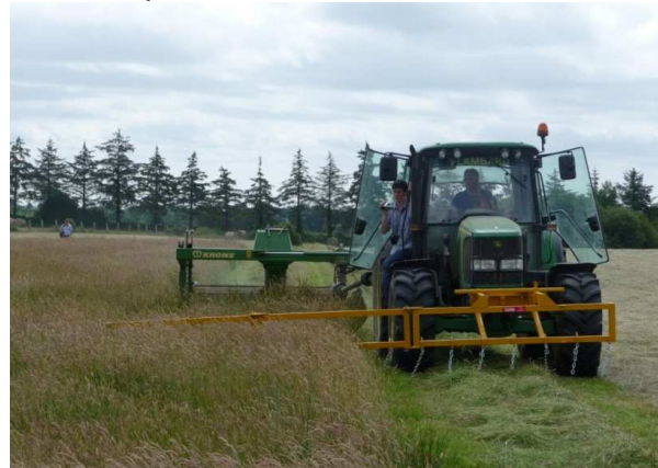
Tracteur équipé d'une barre d'effarouchement

Présentation du programme Agrifaune et des actions menées dans la Manche pendant l'année 2010, année de la biodiversité.