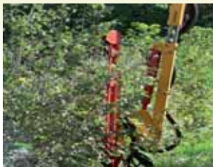
Taille haie pour jeunes rameaux

Pour plus de renseignement, n'hésitez pas à consulter le site : www.polebocage.fr