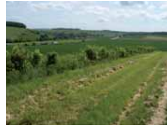
Haie brise vent implantée en 2007