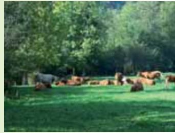
Haie et troupeau