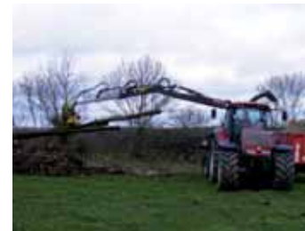
Chantier de coupe de bois